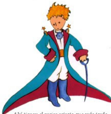
Aquí tienen el mejor retrato que más tarde logré hacer de él

Me puse en pie de un salto como herido por el rayo. Me froté los ojos. Miré a mi alrededor. Vi a un extraordinario muchachito que me miraba gravemente. Ahí tienen el mejor retrato que más tarde logré hacer de él, aunque mi dibujo, ciertamente es menos encantador que el modelo. Pero no es mía la culpa. Las personas mayores me desanimaron de mi carrera de pintor a la edad de seis años y no había aprendido a dibujar otra cosa que boas cerradas y boas abiertas.